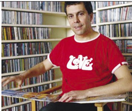
Valiño: una enciclopedia viva del rock

"Todo lo que rodea a un artista puede contribuir a que se le llegue a considerar un mito o a que no se le recuerde más. Tal