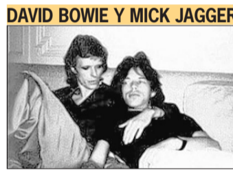
DAVID BOWIE Y MICK JAGGER

FALSO. Una leyenda urbana que ha circulado en los últimos años es que Marilyn Manson era uno de los protagonistas de la serie "Aquellos maravillosos años".